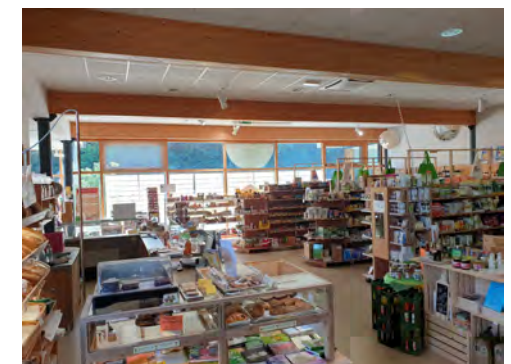
Musterbild - Einrichtung